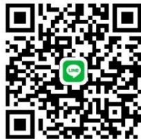
Qr code ไลน์อารักขาพืชอยุธยา

ข้อสังเกต/ข้อสั่งการ - กลุ่มอารักขาพืช ขอความร่วมมืออำเภอประชาสัมพันธ์ไปยังเกษตรกร และขอความร่วมมือเพิ่มเติมในการทำบ่อหรือที่เพาะเลี้ยงพันธุ์แทนแดงสายพันธุ์ที่กรมวิชาการเกษตรส่งเสริมไว้ที่สำนักงานเกษตรอำเภอหรือสถานที่ที่เหมาะสม เพื่อเป็นแหล่งพันธุ์ให้เกษตรกรเข้าถึงได้ง่าย โดยกลุ่มอารักขาพืชก็จะทำบ่อพันธุ์แทนแดงเพื่อเป็นแหล่งพันธุ์ให้อำเภอเช่นกัน และหากเจ้าหน้าที่มีข้อสงสัยเรื่องแทนแดงสามารถเข้าสอบถามในกลุ่มไลน์อารักขาพืชอยุธยา หรือไลน์เกษตรอินทรีย์อยุธยาได้