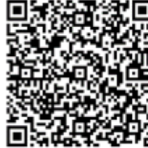
คำนิยามการปลูกพืชฤดูแล้ง