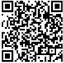
แบบฟอร์มรายงาน

(๒). รายงานการคาดการณ์แผนการเพาะปลูกพืชฤดูแล้ง ปี ๒๕๖๖/๖๗ ให้สำนักงานเกษตรจังหวัดทราบ โดยแยกเป็นพื้นที่ในเขตชลประทาน และพื้นที่นอกเขตชลประทาน รายงาน ตามแบบฟอร์มการคาดการณ์แผนการเพาะปลูกพืชฤดูแล้ง ปี ๒๕๖๖/๖๗ และขอให้รายงานการคาดการณ์ แผนการเพาะปลูกพืชฤดูแล้ง ปี ๒๕๖๖/๖๗ ให้แล้วเสร็จภายในวันที่ ๓๐ สิงหาคม ๒๕๖๖