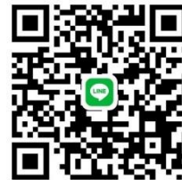
Qr code ไลน์เกษตรอินทรีย์อยุธยา