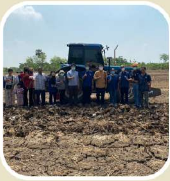
1 ไถกลบแทนการเผา