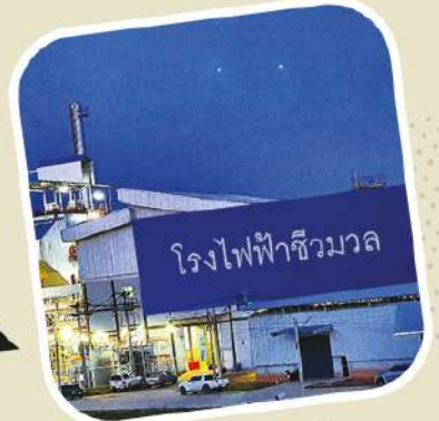
9 ส่งจำหน่าย โรงไฟฟ้าชีวมวล