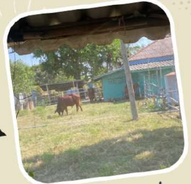
3 เลี้ยงสัตว์