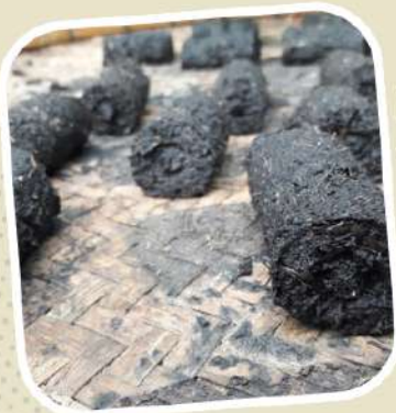
6 พลังงานทดแทน