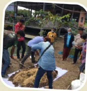
2 ผลิตปุ๋ยหมัก