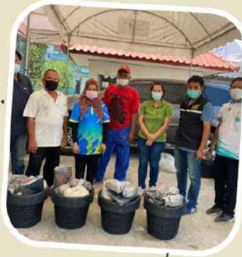
5 เฟาะเห็ด