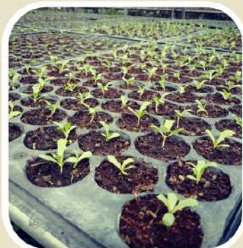
7 วัสดุเฟาะปลูก