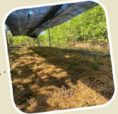
4 หน้่มดิน