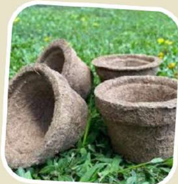
8 แปรรูปเพิ่มมูลค่า