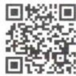
นโยบายคุ้มครอง ข้อมูลส่วนบุคคล กสก.