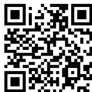
ตรวจสอบรายชื่อการบันทึกข้อมูล