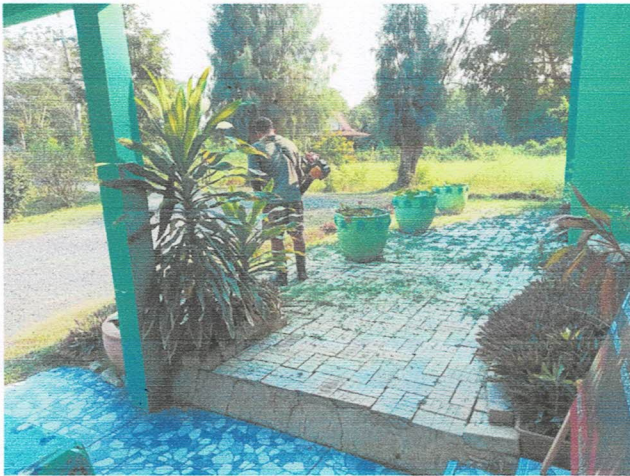
ภาพก่อนทำกิจกรรม