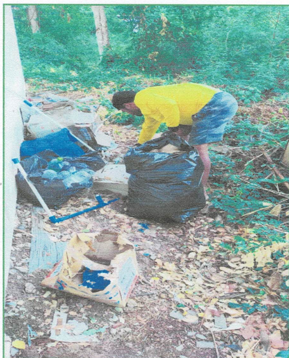
ภาพก่อนทำกิจกรรม