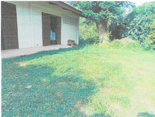
ภาพก่อนทำกิจกรรม