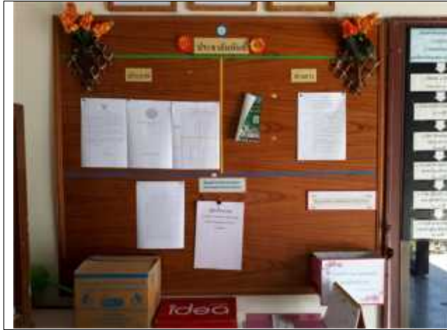
สำนักงานเกษตรอำเภอฝักไถ่