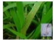
อาการแผลจุดสีน้ำตาลคล้ายรูปตา

พบมาก ในนาข้าว ทั่วพื้นที่เมืองไวมต่อช่วงแสง พบส่วนใหญ่ใน ภาคเหนือ ภาคตะวันออกเฉียงเหนือ ภาคตะวันตก และ ภาคใต้ สาเหตุ เชื้อรา Pyricularia grisea Sacc.