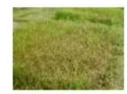
โรคไหม้ระบาดในแปลงกล้า