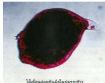
ไล้เดือนฝอยตัวเมียในปมรากข้าว