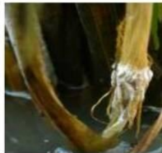
เชื้อราที่ข้อของต้นข้าวที่เป็นโรคยอดฝักดาบ