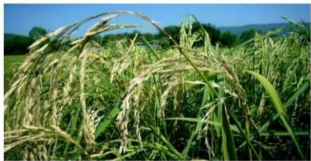
อาการโรคไหม้ในระยะข้าวออกรวง (โรคเน่าคอรวง)

การแพร่ระบาด พบโรคในแปลงที่ต้นข้าวหนาแน่น ทำให้อับลม ถ้าใส่ปุ๋ยสูงและมีสภาพแห้งในตอนกลางวันและชื้นจัดในตอนกลางคืน น้ำค้างยาวนานถึงตอนสายราว 9 โมง ถ้าอากาศค่อนข้างเย็น อุณหภูมิประมาณ 22-25 oC ลมแรงจะช่วยให้โรคแพร่กระจายได้ดี