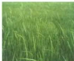
ลักษณะต้นข้าวเป็นโรคยอดฝักดาบ

อาการ พบโรคในระยะกล้า ต้นกล้าจะแห้งตายหลังจากปลูกได้ไม่เกิน 7 วัน แต่มักพบกับข้าวอายุเกิน 15 วัน ระยะเริ่มแตกกอ ข้าวเป็นโรคจะต้นมอมสูงเตี้ยกว่ากล้าข้าวโดยทั่ว ๆ ไป ต้นข้าวมอมมีสีเขียวอ่อนซีด มักย่างปล้อง บางกรณีข้าวจะไม่ย่างปล้อง แต่รากจะเน่าช้าเวลาถอนมักจะขาดตรงบริเวณโคนต้น ถ้าเป็นรุนแรงกล้าข้าวจะตาย หากไม่รุนแรงอาการจะแสดงหลังจากย้ายไปปักดำได้ 15-45 วัน โดยที่ต้นเป็นโรคจะสูงกว่าข้าวปกติ ใบมีสีเขียวซีด เกิดรากแขนงที่ข้อลำต้นตรงระดับน้ำ บางครั้งพบกลุ่มเส้นใยสีชมพูตรงบริเวณข้อที่ย่างปล้องขึ้นมา ต้นข้าวที่เป็นโรคมักจะตายและมีน้อยมากที่อยู่รอดจนถึงออกรวง