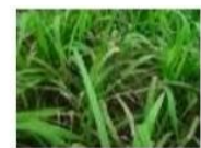
อาการใบไหม้คล้ายน้ำร้อนลวก