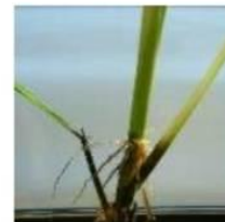
ถ้าไม่ตายจะเห็นรากที่ข้อเหนือน้ำ

การแพร่ระบาด เชื้อราจะติดไปกับเมล็ด สามารถมีชีวิตในซากต้นข้าวและในดินได้เป็นเวลาหลายเดือน พบว่าหญ้าขึ้นภาค เป็นพืชอาศัยของโรค