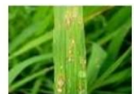
อาการแผลรูปดาตรงกลางมีสีเทา